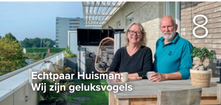
Echtpaar Huisman: Wij zijn geluksvogels

6 Vraag van een huurder: waarom ook vrije sector woningen bij Centrada?