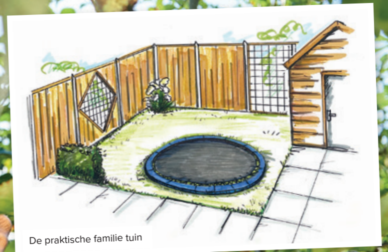
De praktische familie tuin