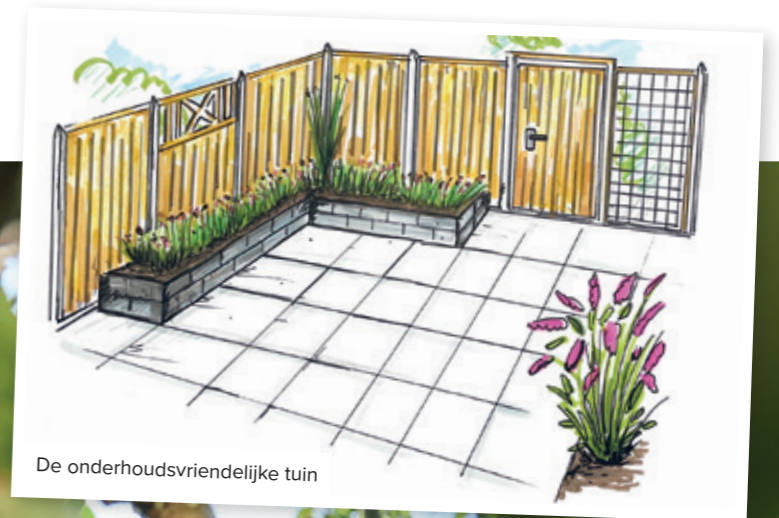
De onderhoudsvriendelijke tuin